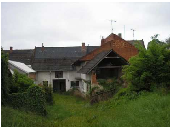
Pohled ze zahrady.