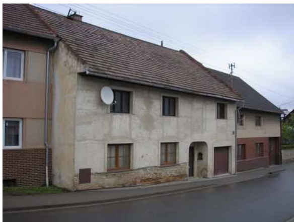
Pohled z ulice.