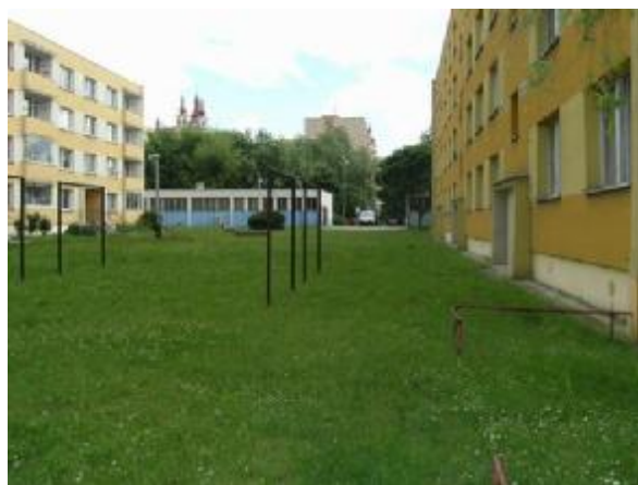
Pozemek za domem