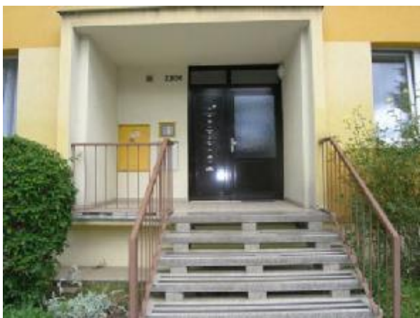
Vchod do domu č.p. 2208