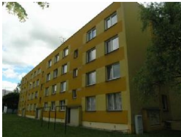
Bytový dům č.p. 2208, 2209 a 2210