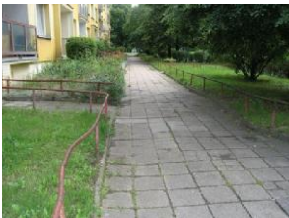
Komunikace u domu