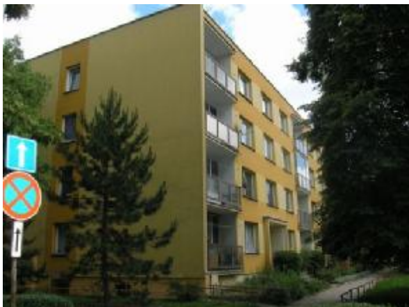
Bytový dům č.p. 2208, 2209 a 2210