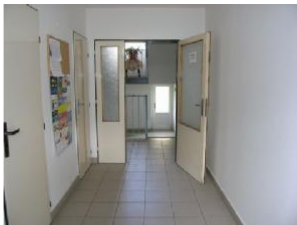
Chodba v domě